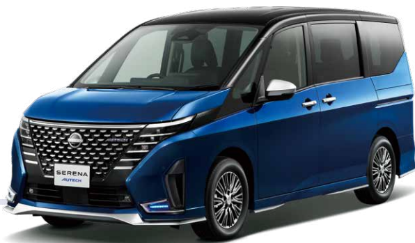
Photo:AUTECH(2WD)。ボディカラーはカスピアンブルー(M) / ダイヤモンドブラック(P) 2トーン(※XGT:スクラッチシールド)(特別塗装色) 【AUTECH専用色】。内装色はブラック(G)。オプション装着車。