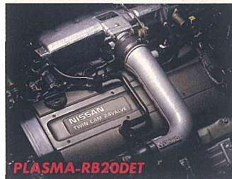
225PSの圧倒的ハイパワー

ハイパワーを誇るRB20DET(ツインカム24バルブ・シリンダーヘッド)をチューニングし、圧倒的な高出力を獲得しました。タービンを大型化したり、軸受をボールベアリングタイプとした高感度ターボチャージャーの採用や、シリンダーヘッドの吸排気ポート形状、カムシャフトの変更等により、出力を225PS/6000rpmと20馬力向上。