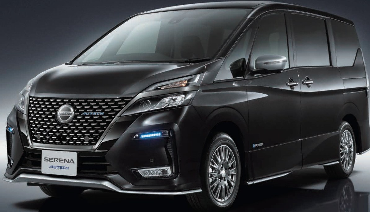
Photo : e-POWER AUTECH Safety Package。ボディカラーはダイヤモンドブラック (P) (#G41 スクラッチシールド) (特別塗装色)。内装色はブラック (C)