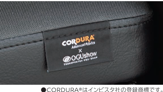
●CORDURA®はインピスタ社の登録商標です。